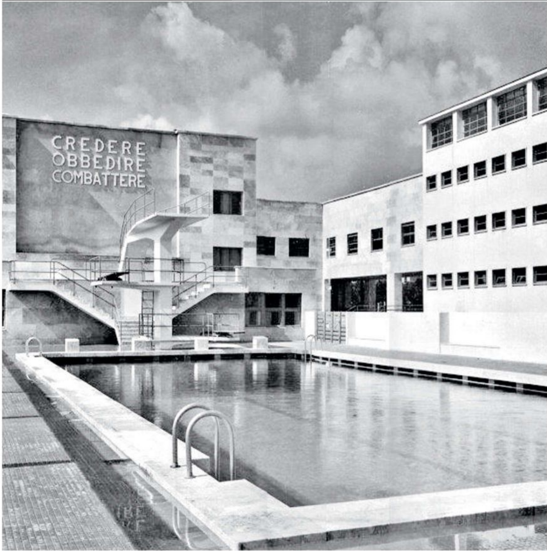
La piscina dell'Ex Gil: uno dei luoghi da visitare in questo fine settimana organizzato da Open House

La guida ai 200 appuntamenti del weekend